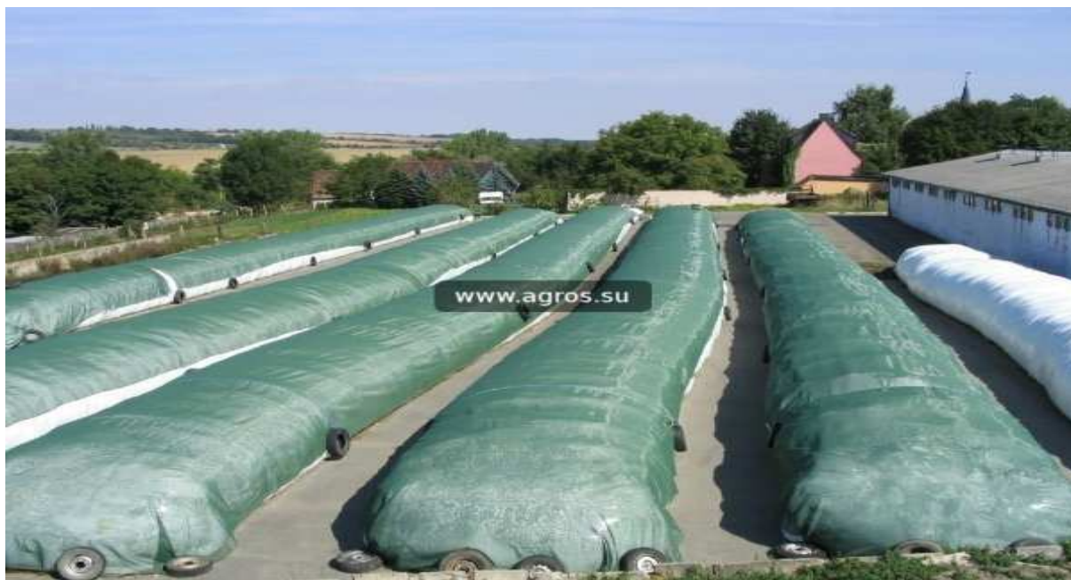
Рис. 3. Хранение силоса в полиэтиленовых рукавах

– не требуется наличия дорогостоящих полевых измельчителей (кормоуборочных комбайнов), так как сенаж формируется в рулоны в не измельчённом виде.