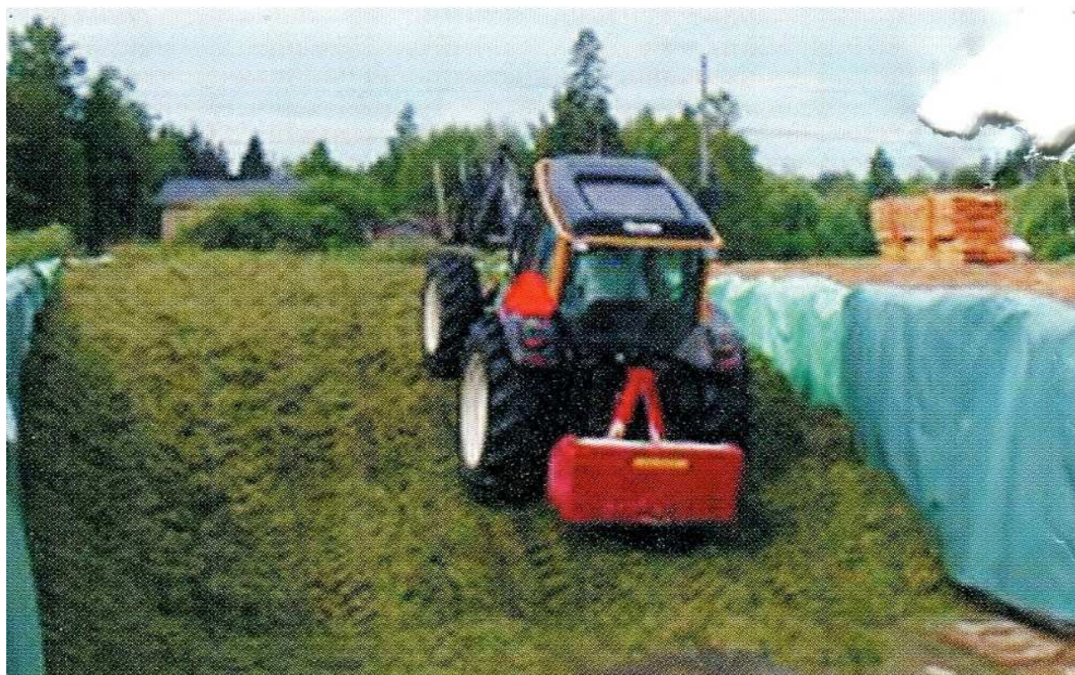
Рис. 4. Качественное укрытие силоса газонепроницаемым пологом

Более прогрессивным является следующий способ укрытия силоса и сенажа (рис. 4).