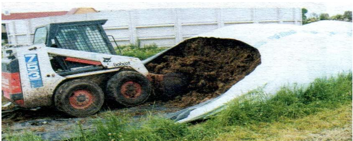
Рис. 8. Способы выемки силоса из плёночных рукавов