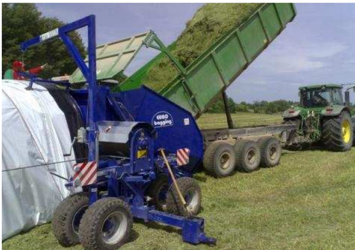
Рис. 5. Загрузка силосуемой массы в плёночный рукав