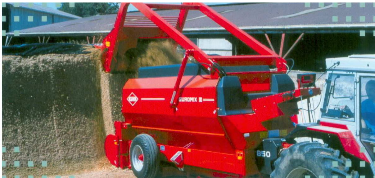
Рис. 7. Прицепной транспортировщик-смеситель-раздатчик кормов с фрезерным погрузчиком

Преимущество этих машин в том, что они не только осуществляют выемку корма, не допуская разрушения его монолитности, но и одновременно выполняют функцию транспортировщика, смесителя и раздатчика силоса (сенажа) или кормосмеси животным.