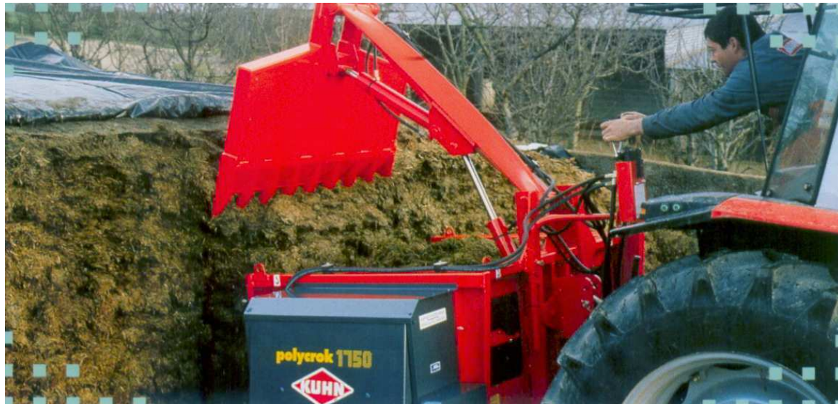
Рис. 6. Выемка силоса из траншеи вертикальными слоями

Чтобы уменьшить отрицательные последствия от проникновения воздуха в толщу массы при выемке силоса и сенажа, покрытия с траншей нужно снимать постепенно (не более 1,0–1,5 м по длине хранилища). Нельзя снимать покрытия бульдозером по всей поверхности траншей, так как значительная часть корма вместе с покрытием идёт в отход. Выбирают силос и сенаж слоями по всей ширине и высоте траншеи, предварительно отрубая его от основной массы (рис. 6).