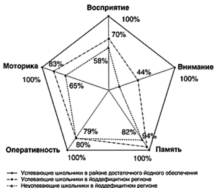
Рис.1. Показатели когнитивных функций детей младшего школьного возраста (показатели группы сравнения приняты за 100%)

организма, что безусловно является фактором риска состояний нарушенного развития, в т.ч. психоэмоциональных и соматических расстройств.