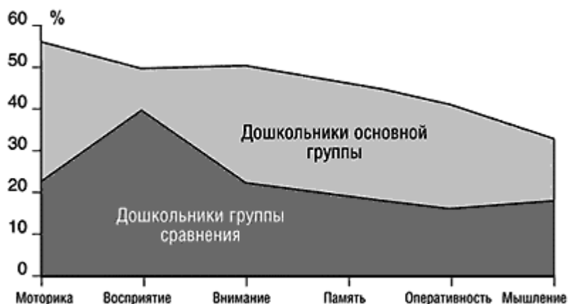
Рис. 3. Вклад дефицита йода в формирование когнитивных нарушений у дошкольников (по показателям атрибутивного риска)

и формирования высших психических функций, влияя на эффективность механизмов восприятия, памяти, сенсомоторной и аналитикосинтетической деятельности. Следует также отметить, что с возрастом относительный вклад дефицита йода в формирование таких сложно организованных психических функций, как мышление, оперативно-мыслительная деятельность, память, несколько снижается, но остается значимым (или даже возрастает) для функций внимания, восприятия и мелкой моторики.