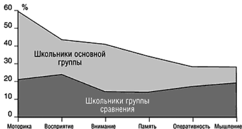
Рис. 4. Вклад дефицита йода в формирование когнитивных нарушений у школьников (по показателям атрибутивного риска)

С помощью метода пошаговой множественной регрессии, помимо дефицита йода, выделен еще ряд факторов, оказывающих воздействие на формирование познавательных способностей ребенка. Среди таких факторов отмечены: наличие перинатальной патологии, малая продолжительность грудного вскармливания, низкий социально-экономический статус семьи, наличие у ребенка хронических соматических заболеваний (табл. 1).