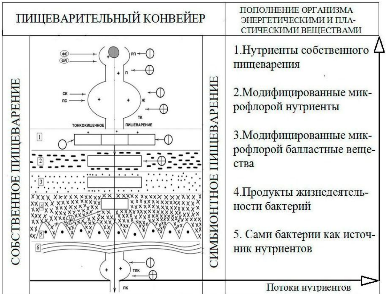
Рис. 4 . Схема пищеварительного конвейера человека.

Сопоставляя полученные нами данные о процессах симбионтного пищеварения с механизмами собственного пищеварения, пищеварительный конвейер человека можно представить следующей схемой (рис. 4).